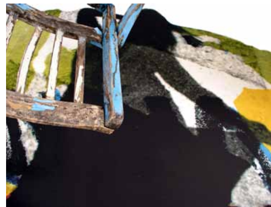
▲▲ o. T., 2008, 50 x 70 cm, Fotocollage auf Leinwand ▲ o. T., 2009, 50 x 70 cm, Fotocollage auf Papier