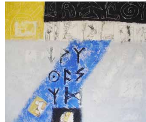
▲▲ Synergie 1 , 2008, 100 x 115 cm, Acryl auf Leinwand ▲ Synergie 2 , 2008, 100 x 115 cm, Acryl auf Leinwand