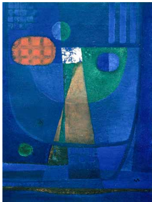
▲ Margret Thomann-Hegner: Der König , 1971, Öl, 80 x 100 cm